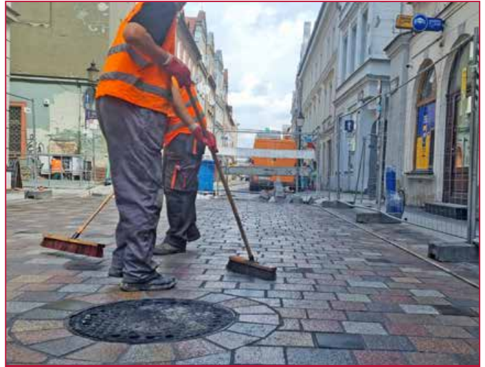
Abkehren für ein sauberes Endergebnis