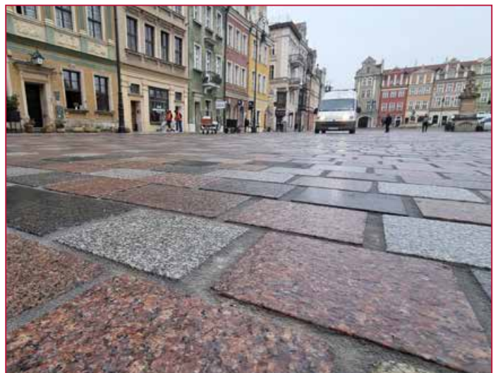
Sauberes, ansprechendes Fugenbild mit ROMPOX® - D1