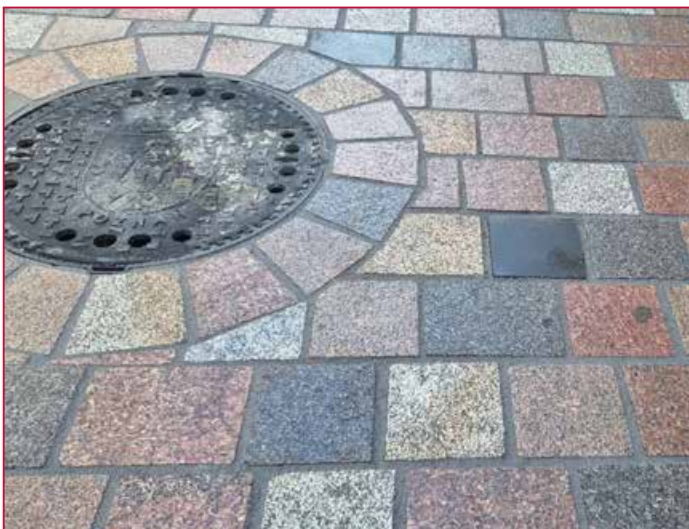
Einbauten perfekt verfugt