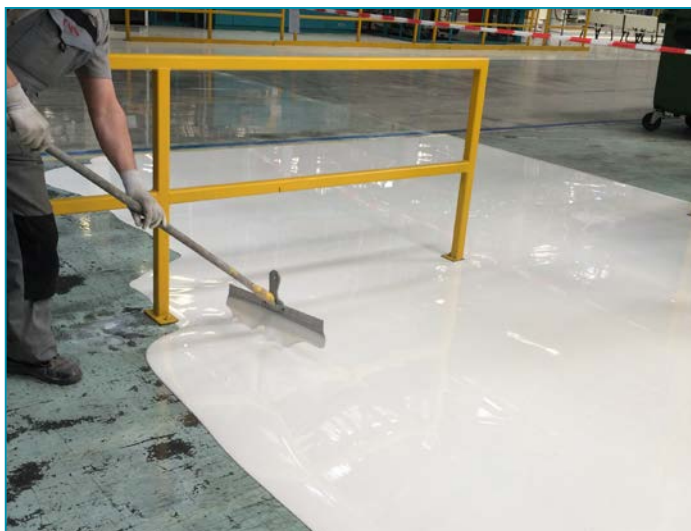
Auftragen der Beschichtung | Aanbrengen van de coating

75 000 m 2 Automobiellacoatings bij VDL Nedcar B.V.