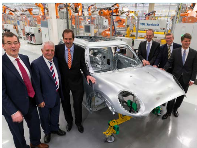
VDL und BMW Vorstände „stehen AUF ROMEX“ - Beschichtungen" VDL en BMW directies „staan OP ROMEX“ - coatings"