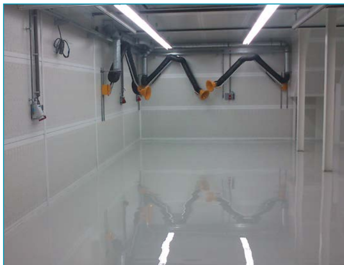
Fertige Lackierhalle | Afgewerkte gelakte hal