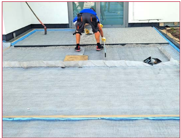
Geotextil als Trennlage unter dem Splitt