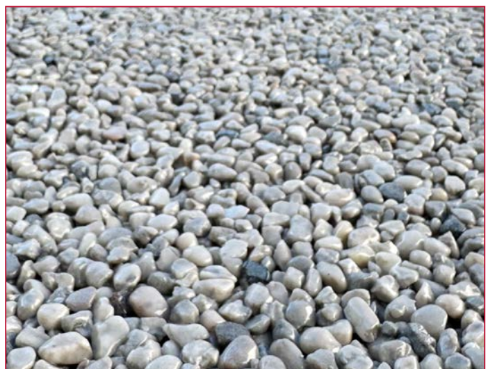
2/5 mm Splitt