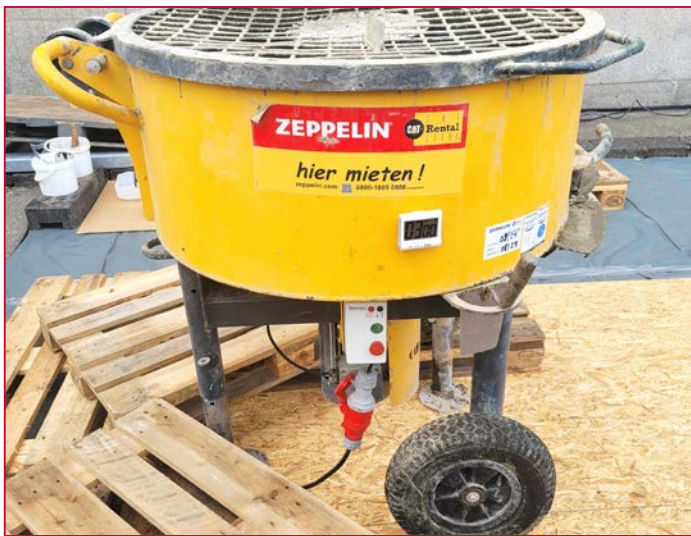
Große Baustellen erfordern große Mischer