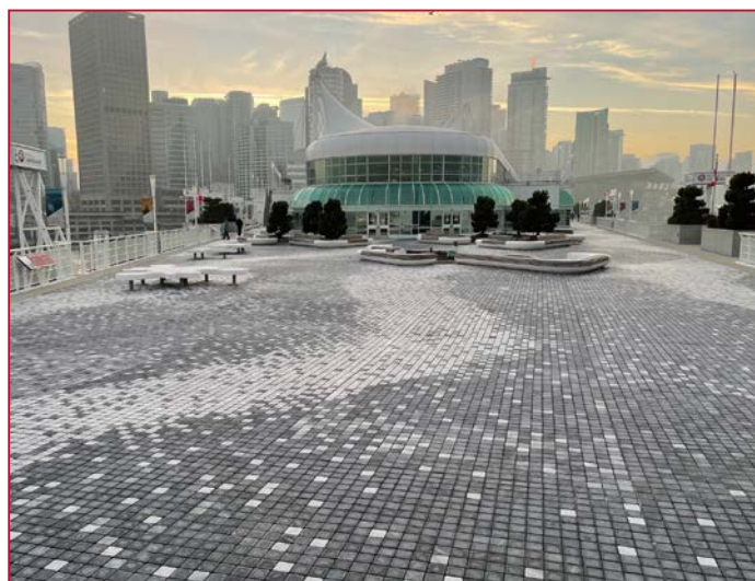
Totale der fertigen Fläche – Perfektes Ergebnis