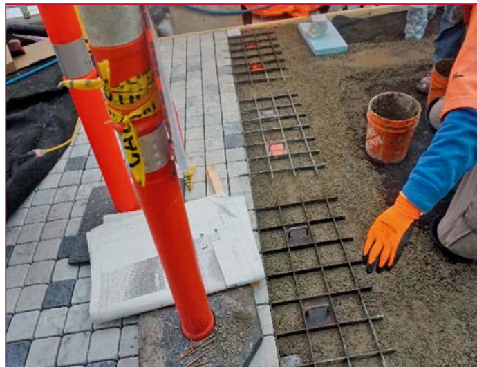
Präzises Verlegen der Steine mit Verlegehilfe