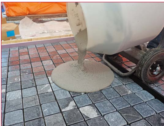
Der wasserdurchlässige Fugenmörtel ROMPOX® - D1