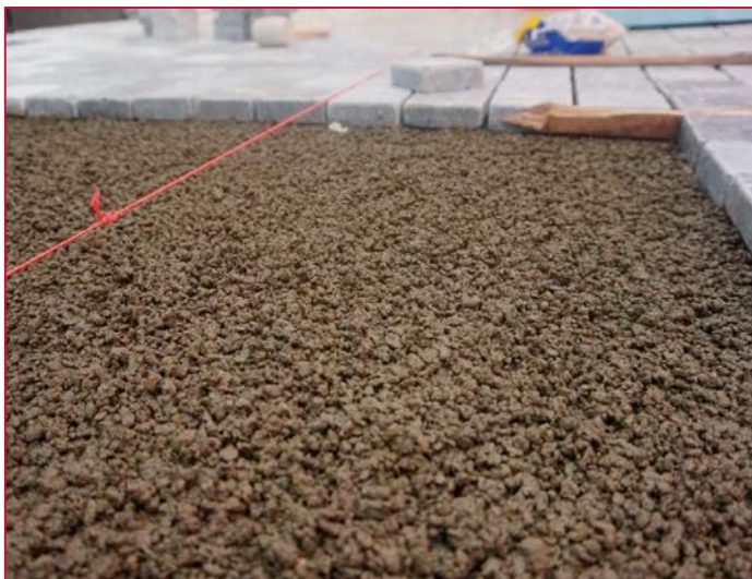
Wasserdurchlässiger Oberbau dank des Trass-Bettungsmörtels