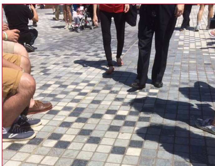
Résistance éprouvée face à une fréquentation extrêmement élevée