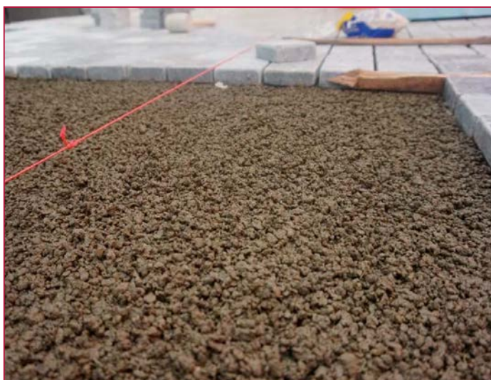
Structure perméable grâce au mortier de lit au trass