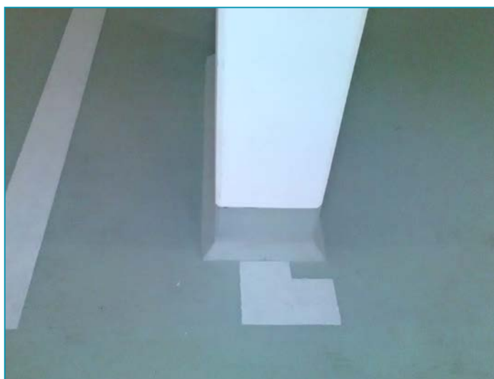
Hohlkehle | Hollow concave