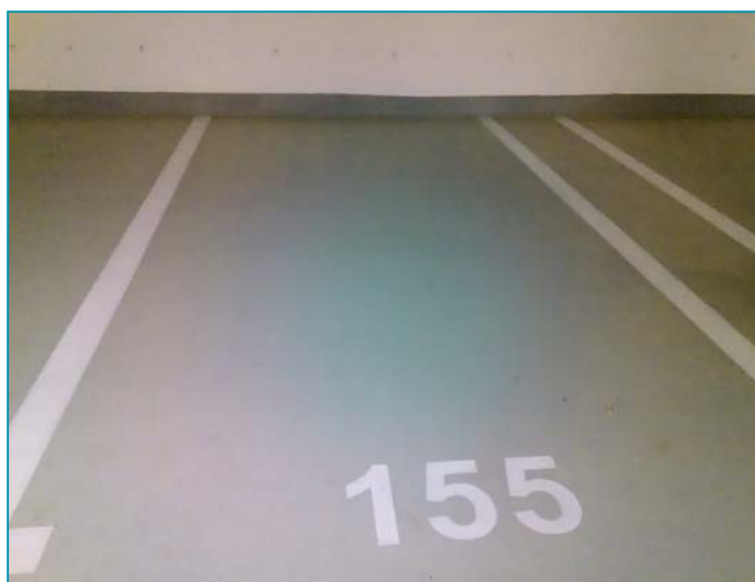
Stellplatzmarkierung | Parking space marking