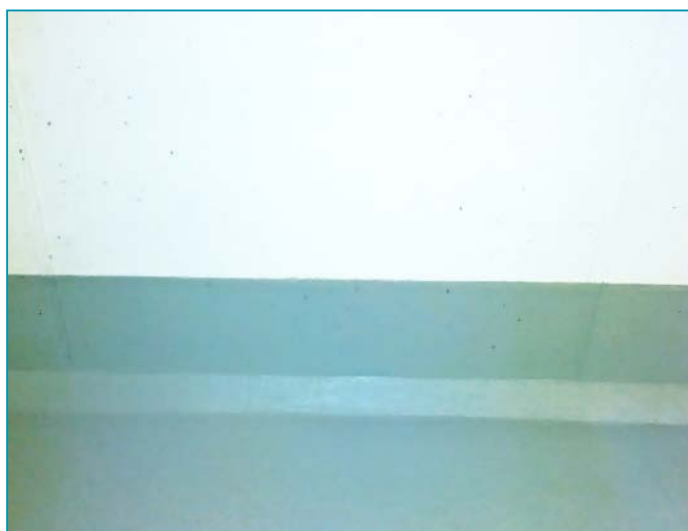
Wandanschluss | Wall connection