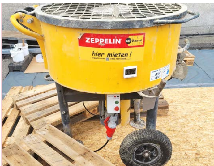
Les grands chantiers nécessitent de grands malaxeurs