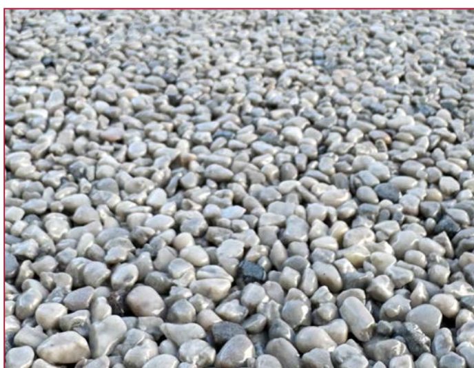
Gravier 2/5 mm