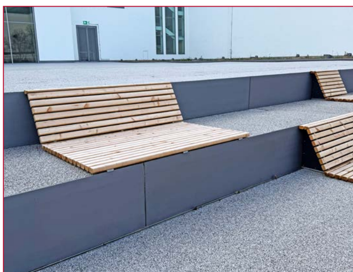
Escalier avec sièges