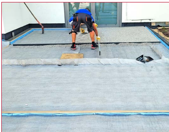
Géotextile comme couche de séparation sous le gravier